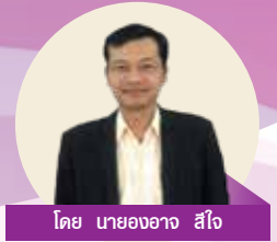
โดย นายอชชา สใจ

เนื่องด้วยสถานการณ์แพร่ระบาดของเชื้อไวรัสโคโรนาสายพันธุ์โควิด-19 ที่เกิดขึ้นทั่วโลกในหลายประเทศ โดยเฉพาะในทวีปยุโรป ที่มีความรุนแรงขึ้นทุกวันรวมถึงประเทศไทยด้วย ทำให้ระบบเศรษฐกิจการเงินเกิดความเสียหาย ส่งผลกระทบต่อการดำรงชีวิตของประชาชนทุกคน ประธานและคณะกรรมการสหกรณ์ออมทรัพย์ครูตาก จำกัด ชุดที่ 60 จึงมีมาตรการช่วยเหลือสมาชิกของสหกรณ์ดังนี้